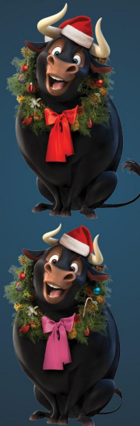
Illustration: © Twentieth Century Fox Film Corporation. Alle Rechte vorbehalten. © Twentieth Century Fox Film Corporation. Alle Rechte vorbehalten.

Im ganzen Weihnachtstrubel ist FERDINAND so Einiges durcheinander geraten. In den zwei Bildern unten verstecken sich 8 Fehler, Findest Du alle?